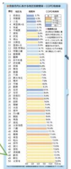
奈良しみんだより 平成29年4月より